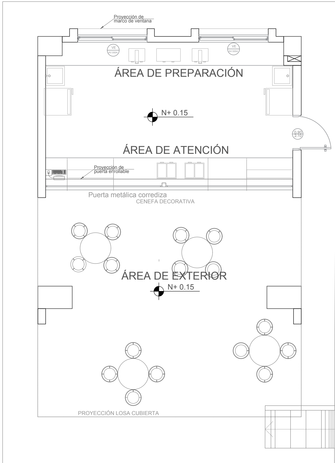
PLANTA ESC 1:100